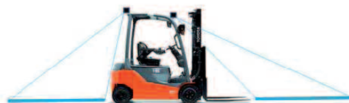
Segnalazione anticipata anteriore e posteriore